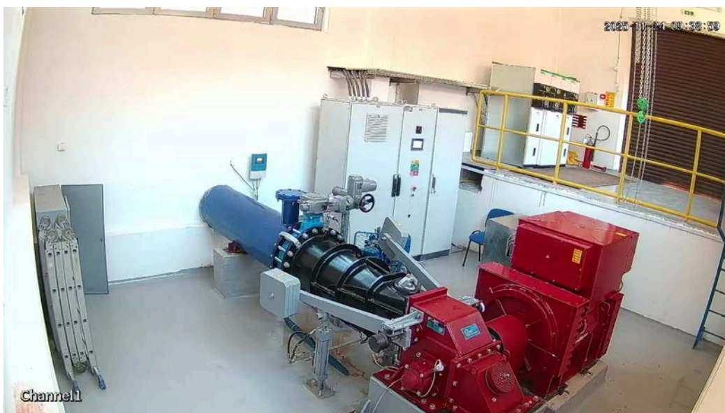
слика 2 - Турбина и генератор на ХЕЦ Б