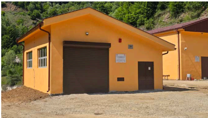
слика 1 - Машинската зграда на ХЕЦ Б