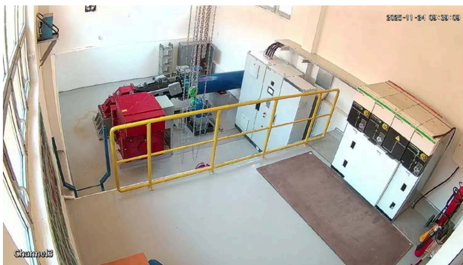
слика 3- Среднонапонски и нисконапонски ормари на ХЕЦ Б